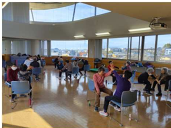
ペアで楽しそうですね！