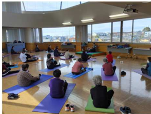
マットも使用していますよ！