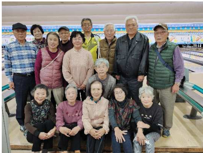
12月6日の大会参加者

12月6日には、過去6ゲームの結果からハンディキャップを算出した大会を開催。結成4年目になりますが、皆さん少しずつ上達しており、成績もよくなってきています。