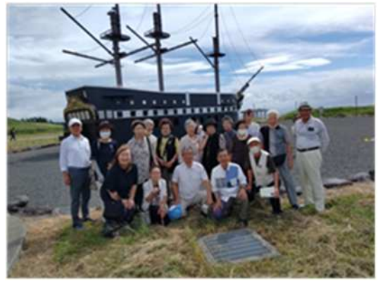
ふじのくに公園のディアナ号前