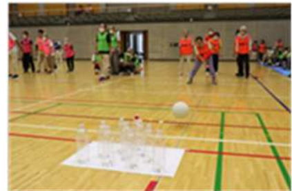
ペットボトルボウリング