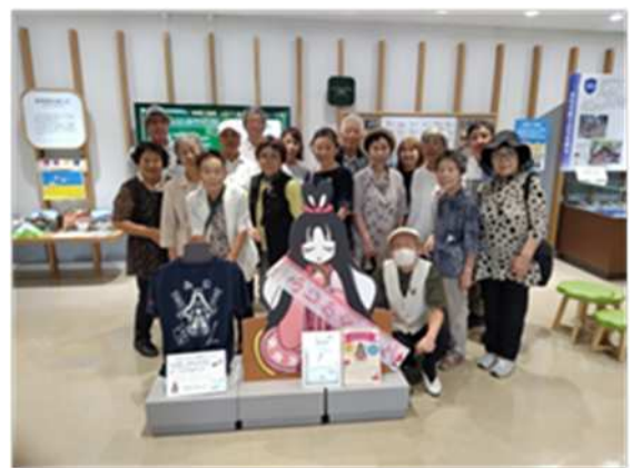
富士山かぐや姫ミュージアム

少し疲れ気味ではありましたが、バス内でのビールでの宴会からスタートして、話も弾み、大変楽しいひと時でした。