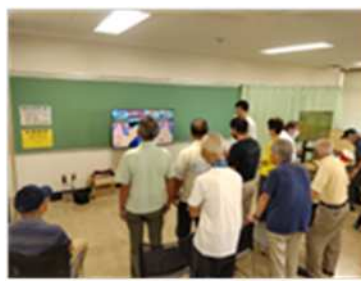
スイッチ：ボウリング