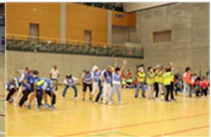
メディシングボール