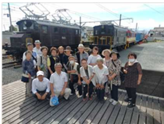
岳南鉄道：富士岡駅「がくてつ広場」