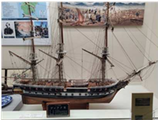
ディアナ号(富士山かぐや姫ミュージアム)