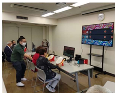
参加者による体験