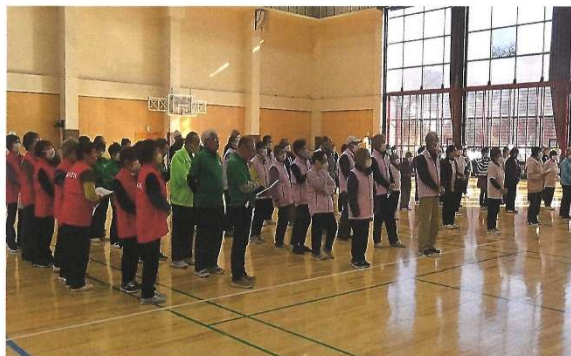
寒さに負けず東部地区5市町から約100名の仲間が集まってくれました