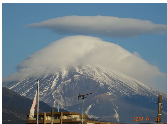
五重の傘雲からの変化後(8時30分)