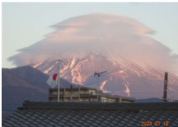
傘雲の出来始め(7時40分)