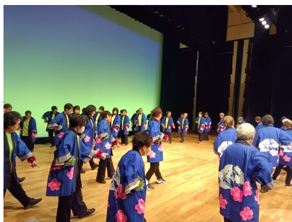
きよしのズンドコ節