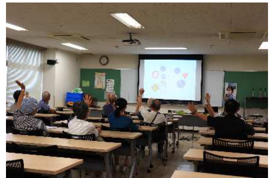
スライドを使った紹介