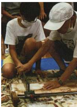
⑤そば切機にて、細かく切る