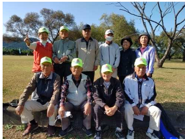
下長窪の選手と応援の皆さん