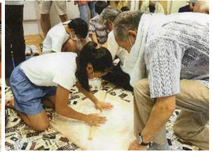
④ノシ板に乗せ、うち粉をかけて、延ばす