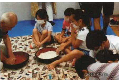
③水を入れ、こねて玉を作る