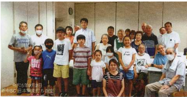
参加者全員による集合写真