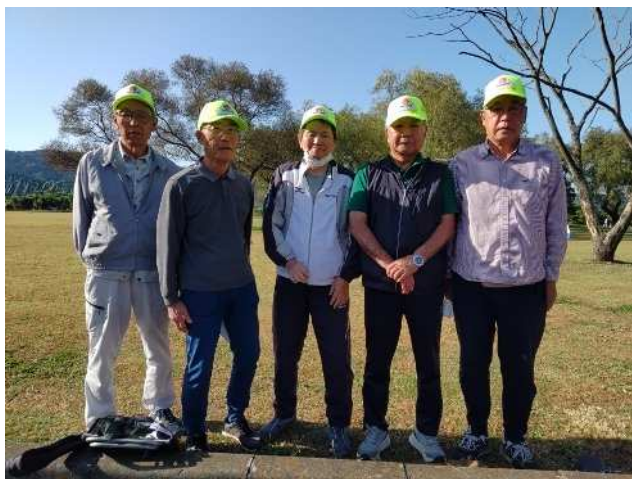
原の選手の皆さん