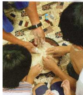
①そば粉・小麦粉準備