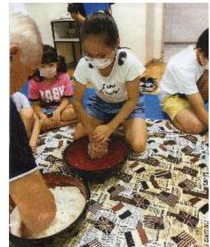
②コネ鉢でよく混ぜる