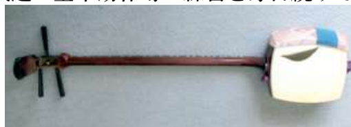
胴貼りの皮が破れた三味線

もっと他になにかやることはないかと、25年前にやっていた三味線でもまた始めてみよう、納戸から取り出してみた所、何と胴貼りの皮が破れていて、専門店で見ってもらった結果24,000円(税別)かかるとのこと。年金生活の自分にはちょっと修理は無理だ、とあきらめました。